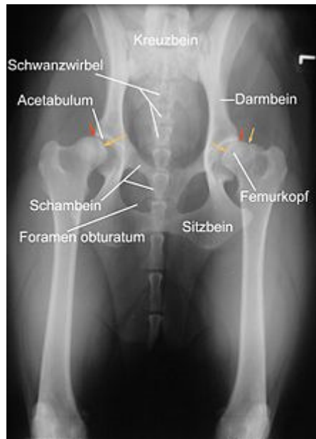
Abb. 1: Röntgenaufnahme einer HD beim Hund

Röntgenaufnahme einer HD beim Hund. Der Femurkopf ist bereits subluxiert, das Acetabulum (Hüftgelenkspfanne) umgreift ihn nicht mehr (rote Pfeile). Die Femurköpfe zeigen Abweichungen von der Halbkugelform (gelbe Pfeile). Rechts im Bild sind deutliche arthrotische Veränderungen des Femurkopfes erkennbar.